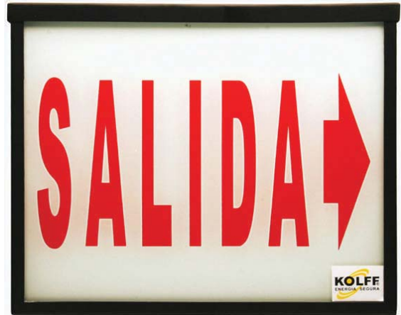
ES-1100 S ES-1100 D