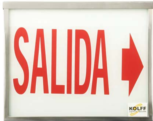
ES-1100 S INOX ES-1100 D INOX