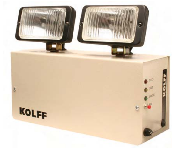
2 x 20 W Halógenos