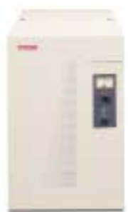
Modelo RET 9-4