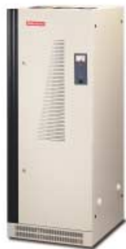
Modelo RET 150-4

Hacia 1974, SALICRU, consciente de esta problemática, patenta y fabrica el primer estabilizador completamente electrónico del mercado: el RE , de tecnología que ha sido y es, un referente para el resto de fabricantes mundiales, destacando por aunar las ventajas de las dos tecnologías imperantes, pero sin sus inconvenientes. Tal innovación ha permitido extender el alcance de esta tecnología a aplicaciones, entonces inimaginables, y que hoy son habituales en multitud de procesos industriales.